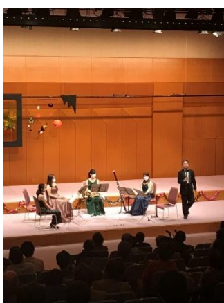
■第1部 京フィル木管五重奏演奏と楽器紹介コーナー